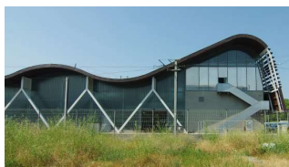
Garage-Atelier du tramway [Jacques Ferrier]