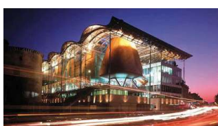
Tribunal de grande instance [Richard Rogers Partnership]