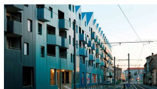
Logements Atrium [ANMA Architectes]