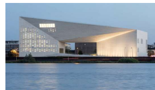
Centre culturel MÉCA [BIG-Bjarke Ingels Group + Freaks]