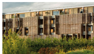
Botanica [Franck Hammoutène]