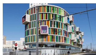
Résidence arc-en-ciel [Bernard Bühler]