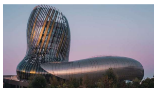
Cité du Vin [XTU Architects]