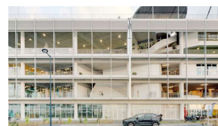
Brazza UCPA Sport Station [NP2F Architectes]