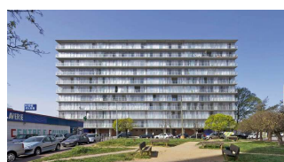
Transformation de 530 logements [Lacaton & Vassal + vv.aa.]