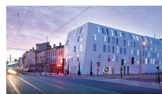
Seeko'o Hôtel [Atelier d'architecture King Kong]