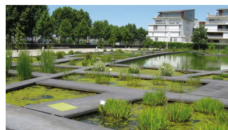
Jardin Botanique [Françoise-Hélène Jourda]