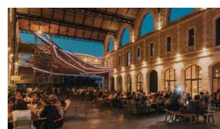
Darwin Eco-système [Olivier Martin + Virginie Gavière]