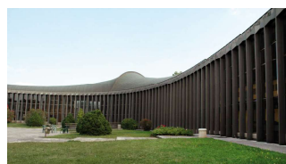
École Nationale de la Magistrature [Guillaume Gillet]