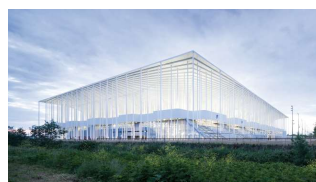
Nouveau stade de Bordeaux [Herzog & de Meuron]